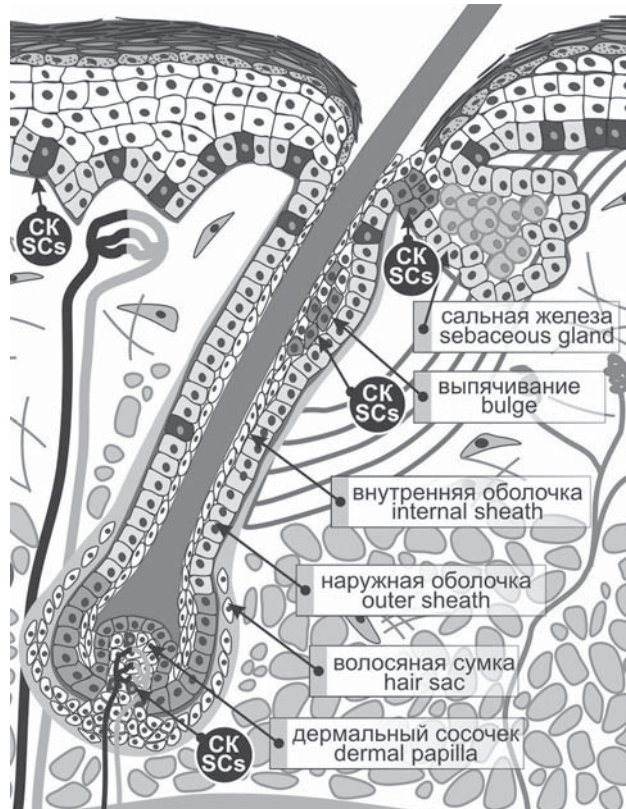
Рис. 2. Схематическое строение волосяного фолликула. Fig. 2. Schematic representation of hair follicle.

The most studied type of adult skin resident SCs are the multipotent epithelial stem cells (EpSCs), that originate ontogenetically from neuroectodermal cells. In adult skin the EpSCs exist as three main proliferating tissue-specific subpopulations: in the basal layer of the interfollicular epidermis, the hair follicle outer shell (the outer epithelial sheath) bulge, and near the sebaceous glands (Fig. 2) [15]. Through the whole life of a human these subpopulations are responsible for the physiological formation of a multilayer stratum epithelium, hair growth, formation of sebum and restoration of skin integrity in a case of damage.